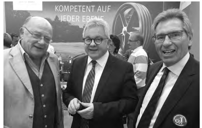
Guido Wolf, Landesminister für Justiz und Tourismus, auf dem Messestand des GC Reutlingen-Sonnenbühl. Links im Bild Clubpräsident Udo Rogotzki und rechts Otto Leibfritz, Präsident des Baden-Württembergischen Golfverbandes (BWGV).

Ein Fazit für die vier Messetage auf der CMT in Stuttgart ist schnell gezogen: „Zum fünften Mal war ich als Clubmanager auf der Messe dabei, und wir profilieren uns immer deutlicher. Die Golf- und Wellnessreisen-Messe hat durch den Umzug in die um 5.000 Quadratmeter größere Halle 10 an Bekanntheit nochmals richtig zugelegt. Man spürt aber auch, dass das Interesse am Golfurlaub wächst. Die Kontakte zu den Interessenten waren auf der Messe schnell hergestellt.“